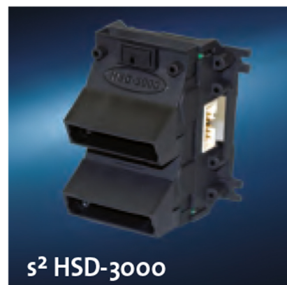
s 2 HSD-3000