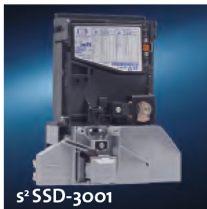
s 2 SSD-3001