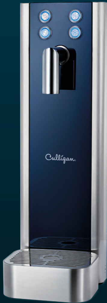
Glass Tower One