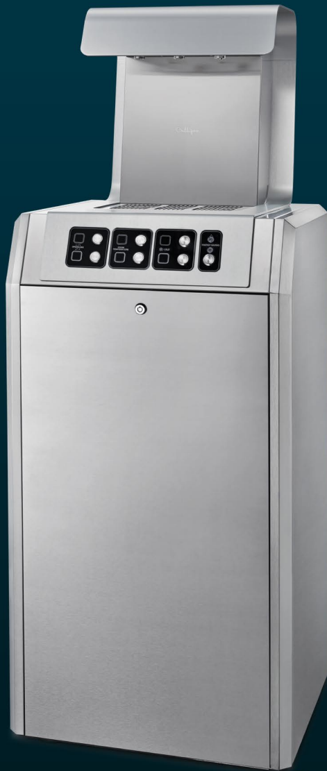
AQUABAR PLUS 150